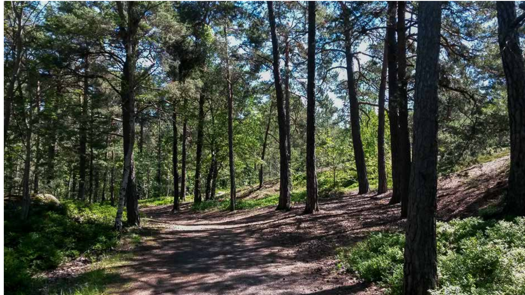
Tre av stadens nämnder ska nu yttra sig om reservatsgränserna. Först ut är exploateringsnämnden.