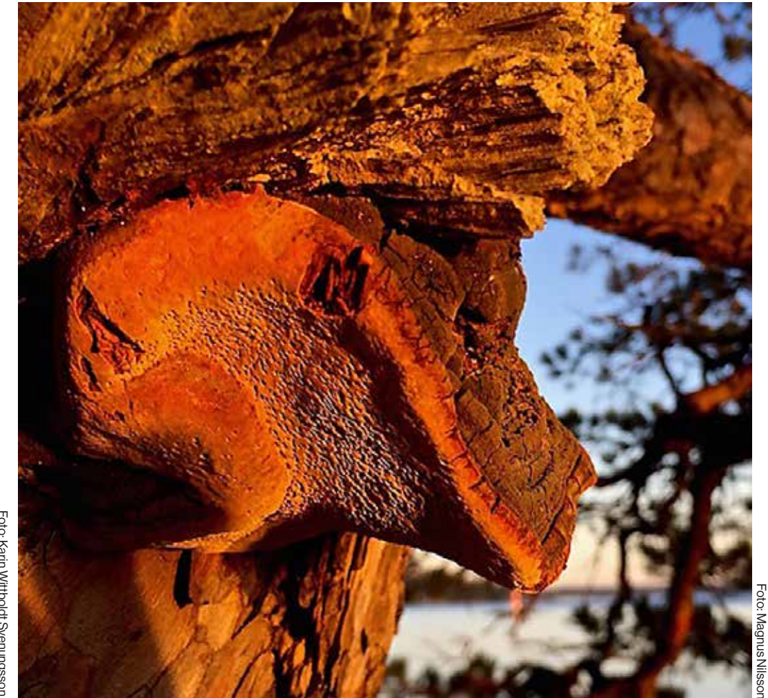
Vedsvampen tallticka är en av de rödlistade arter man kan hitta i Årstaskogen.

Naturskyddsföreningen har pekat på att skogen rymmer ett flertal rödlistade arter från vedsvampen tallticka till rovfågeln duvhök. Utöver